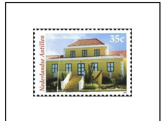
Landhuis Dokterstuijn (ancienne résidence de planteurs de la fin du 18 e siècle, actuellement restaurant)