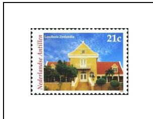
Landhuis Zeelandia (années 1850, actuellement restaurant et bureaux)