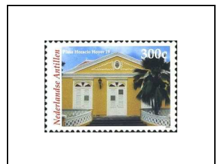
Plasa Horacio loyer 19 (1915-1916, actuellement bureaux gouvernementaux de Curaçao)