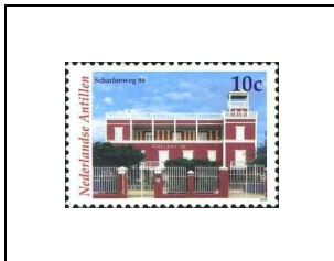
Scharlooweg 86 (Galerie d'Art à Curaçao)