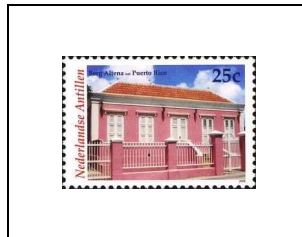
Berg Altena nst. Puerto Rico (résidence du 19 e siècle)