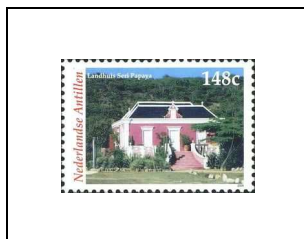
Landhuis Seri Papaya (résidence d'une petite plantation du 19 e siècle, actuellement restaurant)