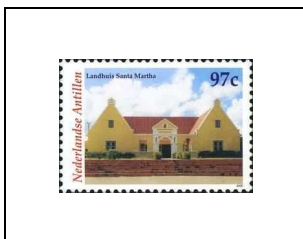
Landhuis Santa Martha (résidence des années 1700, actuellement atelier pour personnes handicapées)