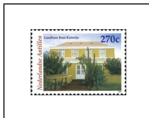
Landhuis Rooi Katoetje (résidence du 19 e siècle, actuellement bibliothèque)